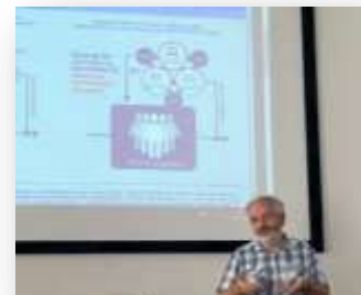
Foto: Mgr. Šrámek hovoří o plánování rozvoje škol za použití IT nástroje. Bez nároku na odměnu přijel až ze Znojma.