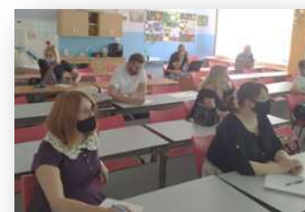
Foto: Jak na distanční vzdělávání?